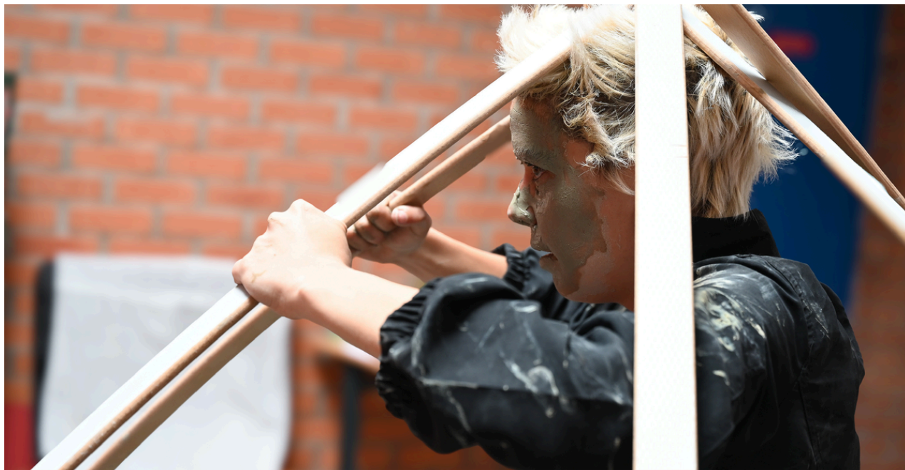
Photo 1 et 4, résidence La Maison du Conte - mai 2024 / photo 2 et 3, sortie de chantier Le Générateur x Le Voyage métropolitain - mai 2024