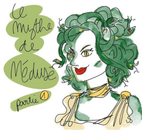
Illustration tirée du recueil “Mythes et meufs” tome 1 de Blanche Sabbah